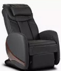
KIN RELAX NOIR

GARANTIE 2 ANS : Pièces + main d'oeuvre + déplacement + transport.