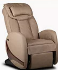
KIN RELAX CHAMPAGNE