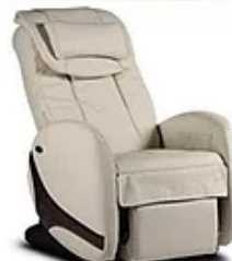
KIN RELAX IVOIRE