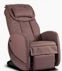
KIN RELAX CHOCOLAT