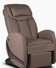
KIN RELAX BRUN